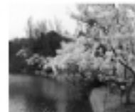
蜷電湖県立自然公園