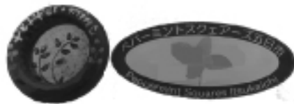
クラブパッチは左が初代、 右が現在のパッチ

広島県広島市佐伯区 2003年6月設立 会員数38名 例会：毎週土曜日午後6：30～9：00 会場：広島市佐伯区民文化センター